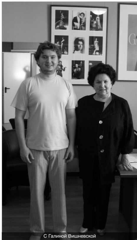
С Галиной Вишневской

– Да, конечно. Она присутствовала на всех спектаклях, которые проходили в Центре оперного пения, также приглашала к себе на уроки, занималась с каждым абитуриентом центра. Её неповторимая энерге-