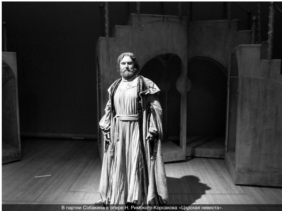
В партии Собакина в опере Н. Римского-Корсакова «Царская невеста».