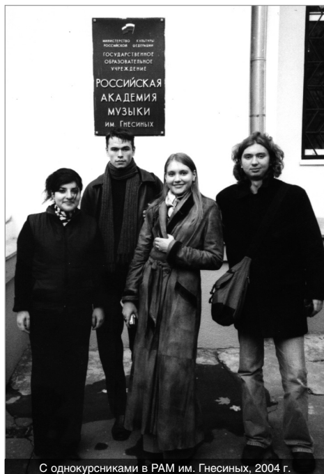
С однокурсниками в РАМ им. Гнесиных, 2004 г.

Гастролировал в Германии, Польше, Швейцарии, а также во многих городах России.