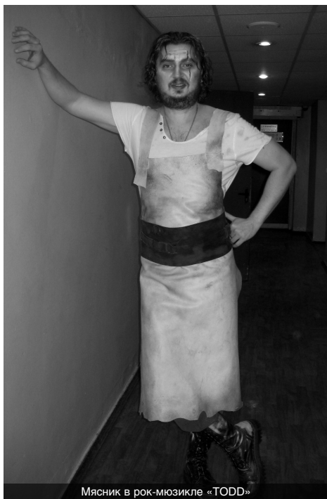
Мясник в рок-мюзикле «TODD»