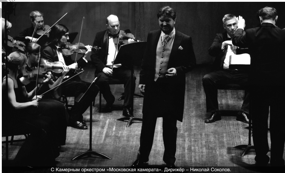
С Камерным оркестром «Московская камерата». Дирижёр – Николай Соколов.

Швейцарии: Берн, Тун, Интерлакен и в живописной деревушке Сигрисвилль, где мы проживали, – там в церкви и состоялся наш первый концерт. Для меня это был большой опыт. Первостепенно – язык. Когда я туда приехал, я немного говорил по-английски и несколько фраз по-немецки, а к концу третьей недели говорил почти свободно. На протяжении всей стажировки с нами занимались приглашенный дирижер, режиссер и педагог по вокалу.